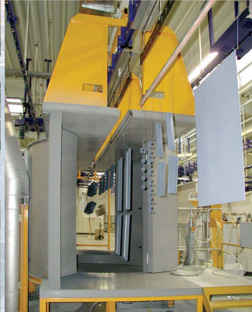
Handbeschichtung für Einzelteile und kleine Losgrößen

Die Automatik-Beschichtung erfolgt mit acht Pistolen. Das Schnellfarbwechselsystem ermöglicht kurze Farbwechselzeiten.